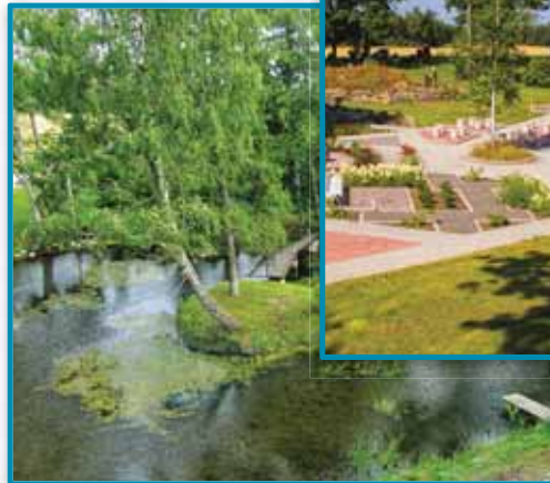
Meelteaed Puhta vee teemapark

Rohkem informatsiooni teemaparki kohta leiab aadressilt: www.metsamoisa.ee https://www.facebook.com/metsamoisa